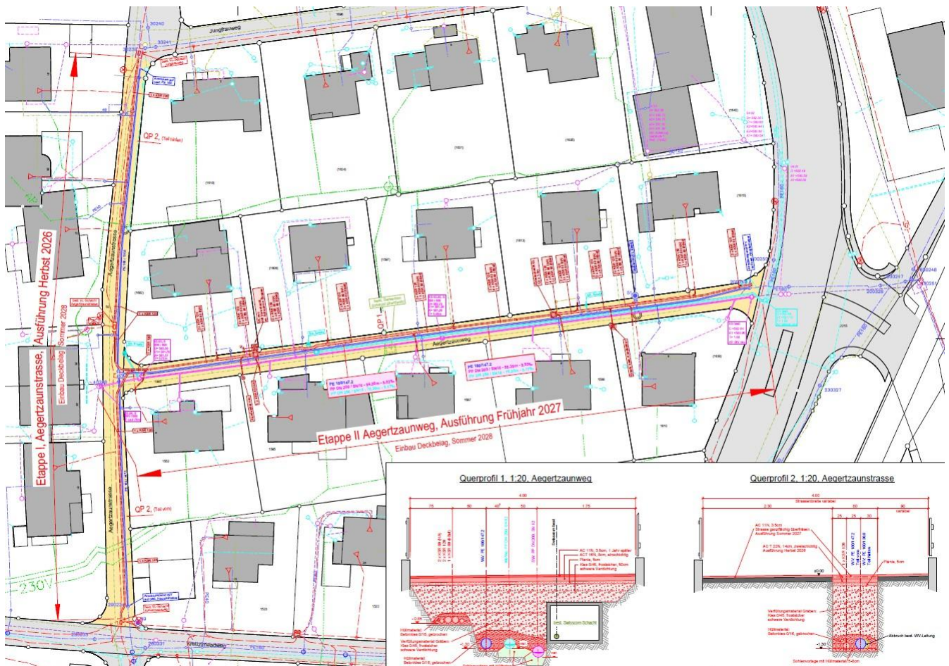
Situation: Werkleitungen Aegertzaunstrasse/Aegertzaunweg

Die Werkleitungen im nördlichen Teil der Aegertzaunstrasse und im Aegertzaunweg sind alt und sanierungsbedürftig. Die verbauten Leitungen haben die Lebensdauer erreicht und müssen ersetzt werden. Bei der Wasserversorgung und bei der Abwasserentsorgung bestehen noch 80-jährige Graugussleitungen, welche teilweise unter den Gebäuden durchführen und bei einem Leitungsbruch nicht mehr erreicht werden können. Ebenfalls sind Liegenschaften teilweise nicht an Hauptleitungen, sondern über Privatgrundstücke angeschlossen. Das Strassenwasser soll neu nicht mehr dem Abwasser, sondern dem Versickerungsbecken zugeführt werden. In der Elektrizitätsversorgung sind die Leitungen in gutem Zustand, hingegen bestehen zum Teil noch Stammkabel und sanierungsbedürftige Schachtdeckel. Durch die Sanierung der Werkleitungen werden sowohl Trag- als auch Deckschicht der Strasse neu eingebaut. Die Ausführung ist im Herbst 2026 (Aegertzaunstrasse) und im Frühjahr 2027 (Aegertzaunweg) geplant. Im Anschluss sind der nördliche Teil der Aegertzaunstrasse und der Aegertzaunweg vollständig saniert.